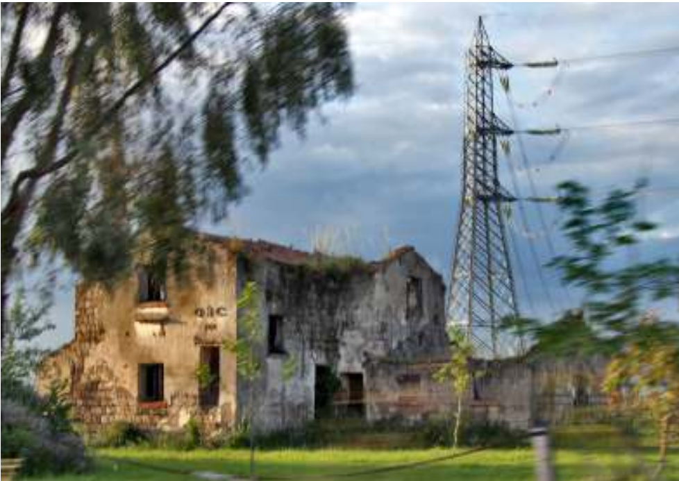
Podere O.N.C. lungo la strada provinciale Aeranova