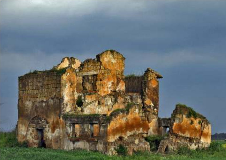
Podere O.N.C. in località aeroporto