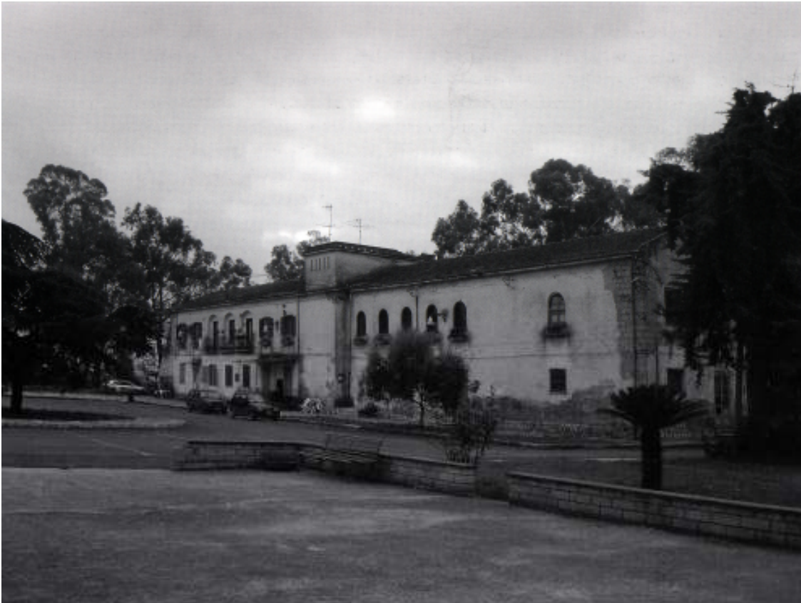
2. Edificio per abitazioni nella piazza di Borgo Appio a Brezza