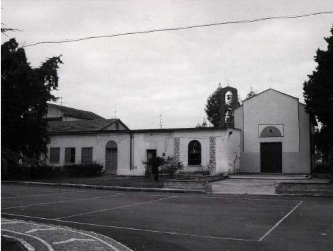
1. La chiesa di Borgo Appio a Brezza