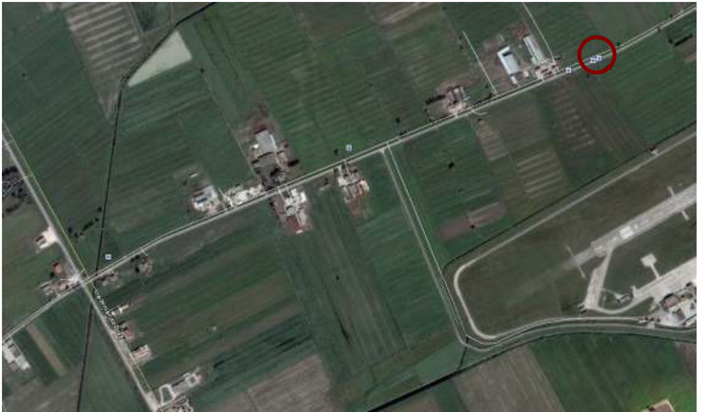
Individuazione masserie in località aeroporto