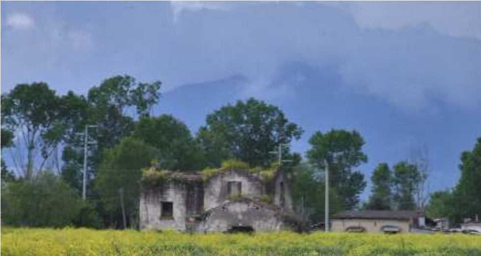
Podere O.N.C. lungo la strada provinciale Aeranova