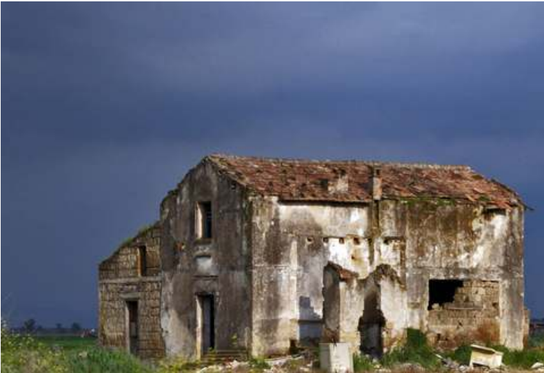
Podere O.N.C. in località aeroporto